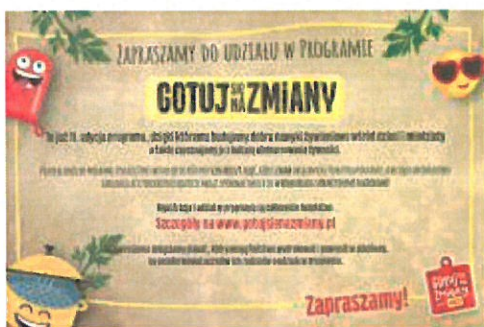
Zaproszenie.jpg ~175 KB