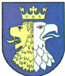
1c919b07.png ~17 KB